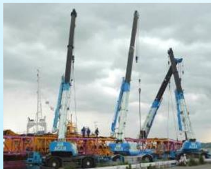
大型クレーンの夜間分解搬送