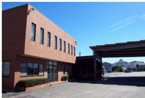
阿久比運輸(株)本社 倉庫面積 150m 2