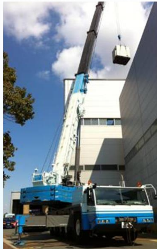
トヨタ系工場での機械設備吊上