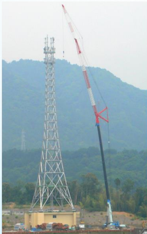
中部電力亀山無線塔建工事