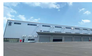
豊明物流センター