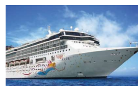
豪華客船クルーズ