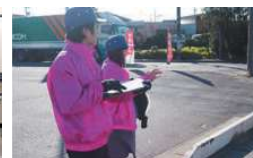
交通安全立哨活動