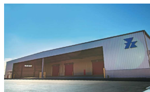
小垣江物流センター