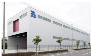
刈谷物流センター

内製化、新規業務などの「コスト削減」「リスク回避」をお考えの方に、御社の物流部門としてご活用ください。