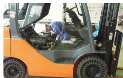
フォークリフト訓練センター開設