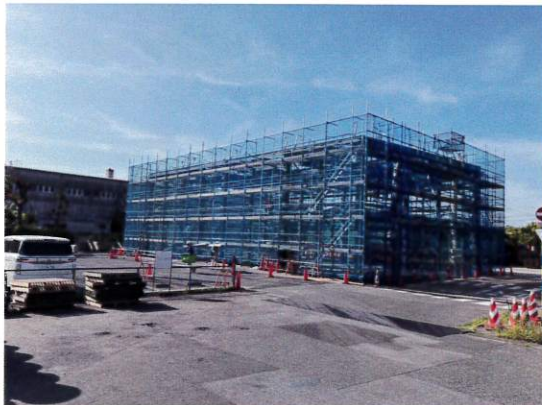
【スーパーゼネコン 某工場 新築足場】