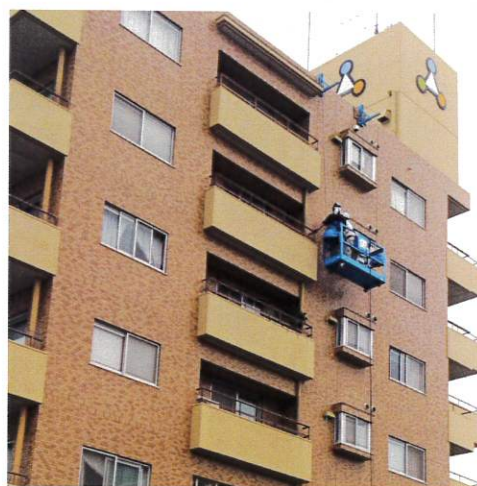
【マンション 点検・補修】