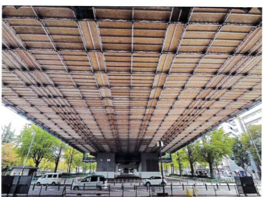
【ゼネコン 高速道路 改修工事 吊足場(クイックデッキライト使用)】