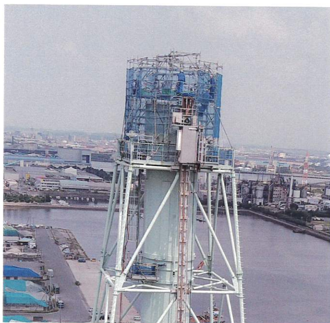
【火力煙突内清掃用ゴンドラ】