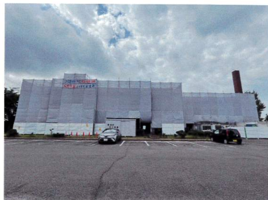
【現場ゼネコン 公共施設 改修工事足場】