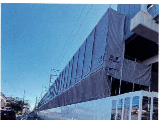
【ゼネコン 鉄道橋梁足場】