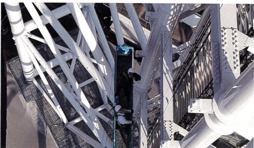
【瀬戸デジタルタワー 塗装】