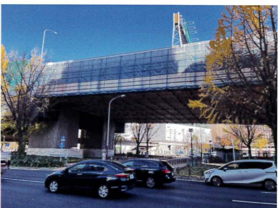
【ゼネコン 高速道路 改修工事 吊足場(クイックデッキライト使用)】