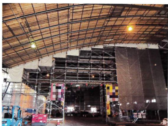
【ゼネコン 倉庫内部改修工事 吊足場・棚足場】