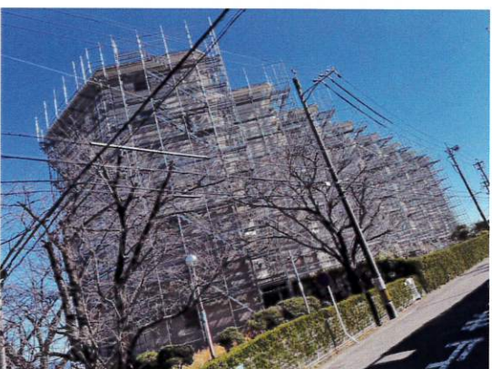
【大規模修繕 マンション改修工事足場】