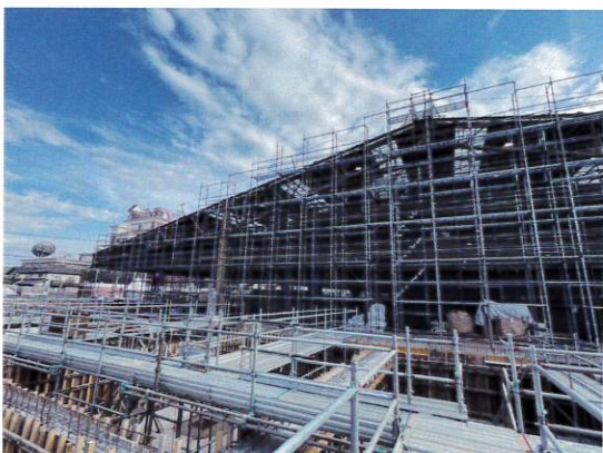
【ゼネコン 運送会社 新築・改修工事足場】