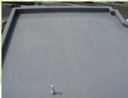
某戸建て住宅屋上防水工事