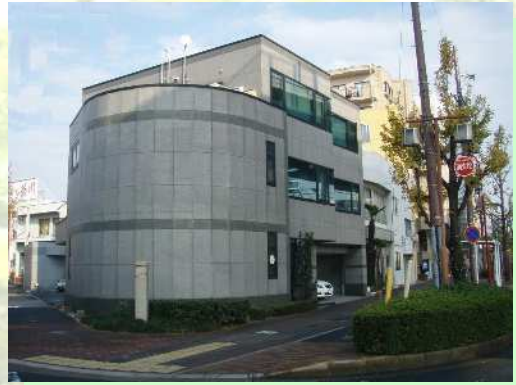
某事務所外壁・石調吹付け塗装

新築から塗り替えまで、お客様のニーズにあわせた様々なパターンを高い技術により、納得の仕上がりを提供致します。