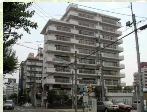
某分譲マンション大規模修繕工事