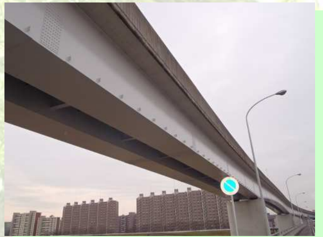
矢田川高架橋塗装工事