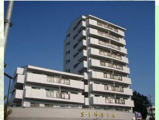
某分譲マンション大規模修繕工事

建物そのものの個性や性質を生かしながら、目的に応じた最良の方法を提案していきます。