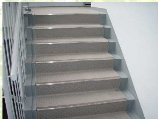
某分譲マンション階段室防水工事