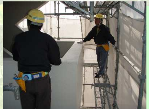
安全・品質パトロール

また、「教育・訓練・資格取得年度計画書」を作成し、社員のみならず、協力会社にも施工管理士、塗装技能士等の資格取得をサポートし、社員・協力会社のスキルアップを図っています。