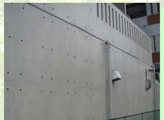
某事務所ビルコンクリート打放し再現塗装