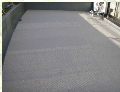
某分譲マンションバルコニー防水工事

建物の漏水を防ぐ防水工事を部位・状況に応じ提案致します。また、塗装前の下地の補修をきちんとする事が建物を長持ちさせる一番の秘けつです。私たちは外から見えない部分の補修こそ重要だと考えています。