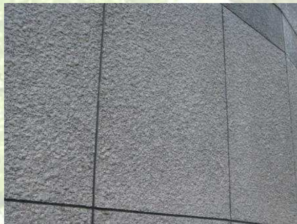
某事務所外壁・石調吹付け塗装