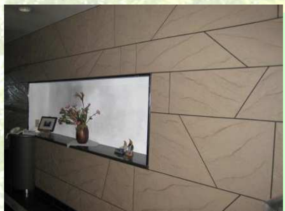
某事務所エントランス・石調吹付け塗装