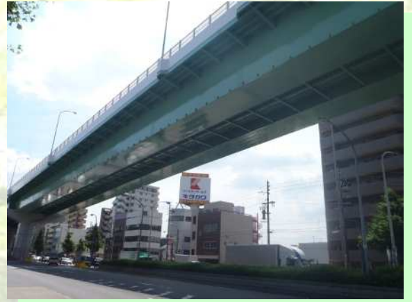
名古屋高速塗装工事

快適な生活や街の景観に欠かせない歩道橋や橋などの塗替え工事も多く手がけています。