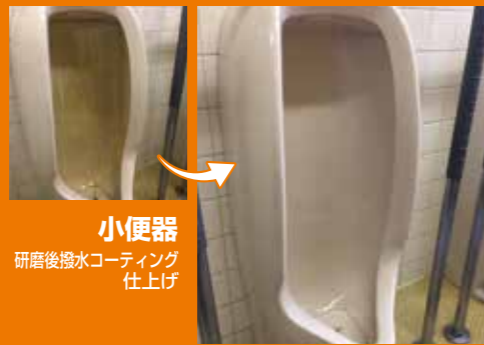
小便器 研磨後撥水コーティング 仕上げ