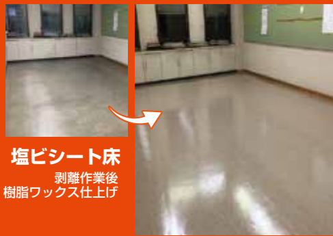
塩ビシート床 剥離作業後 樹脂ワックス仕上げ