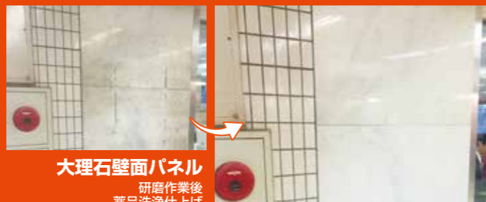
大理石壁面パネル 研磨作業後 薬品洗浄仕上げ