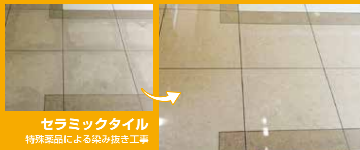
セラミックタイル 特殊薬品による染み抜き工事